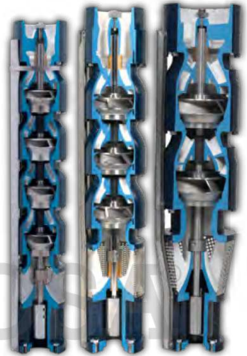
CURVA DE FAMILIA DE TURBINAS SUMERGIBLES SERIE STS