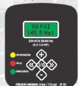
Display del variador

La bomba y controlador están interconectados hidráulica y eléctricamente, e incluyen 1.5 m de cable por cada bomba para conexión a red eléctrica.